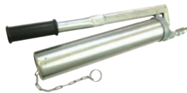
【グリスガン (市販品)】