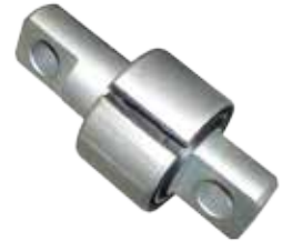
スタビリンカーブッシュ ↑ 純正品番